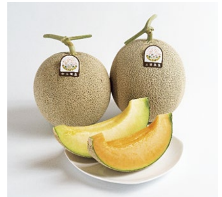
*天候によりどちらかの果肉になる場合があります。