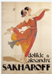
ジョルジュ・バルビエ (クロティルド&アレクサンドル・サカロフ) 1921年