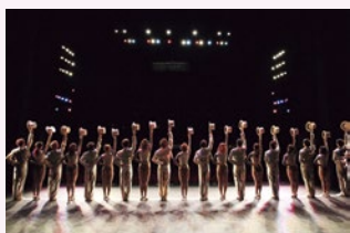
※写真はこれまでの公演より