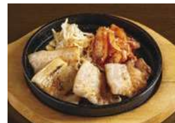
サムギョプサル (通常980円)