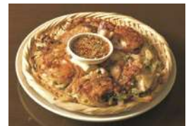
スペシャル海鮮ねぎチヂミ (通常780円)