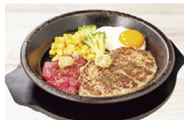
わくわくコンボ ミドル イメージ