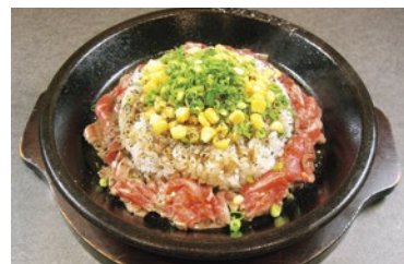
ビーフペッパーライス イメージ