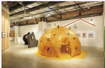
東京会場 展示風景