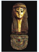
ミイラマスク/ブトレマイオス朝時代