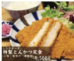
特製とんかつ定食 ご飯・味噌汁・漬物付 1,500円