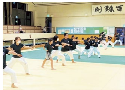
イメージ *実際の会場とは異なります