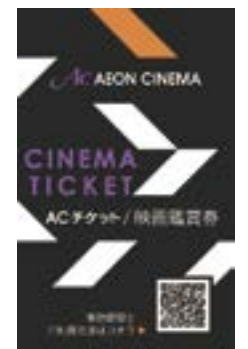
※絵柄が異なる場合がございます。