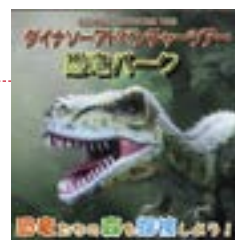
〈新アトラクション〉