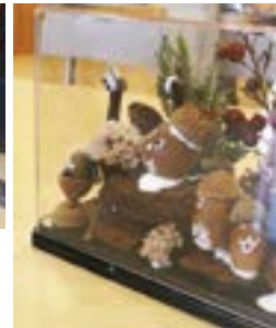
透明ケースサイズ 横17cm×奥8.5cm×高10cm