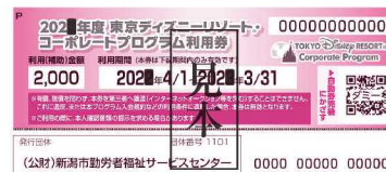
コーポレートプログラム利用券

●利用券を第三者へ譲渡・転売することはできません。違反した場合、利用券は無効となります。